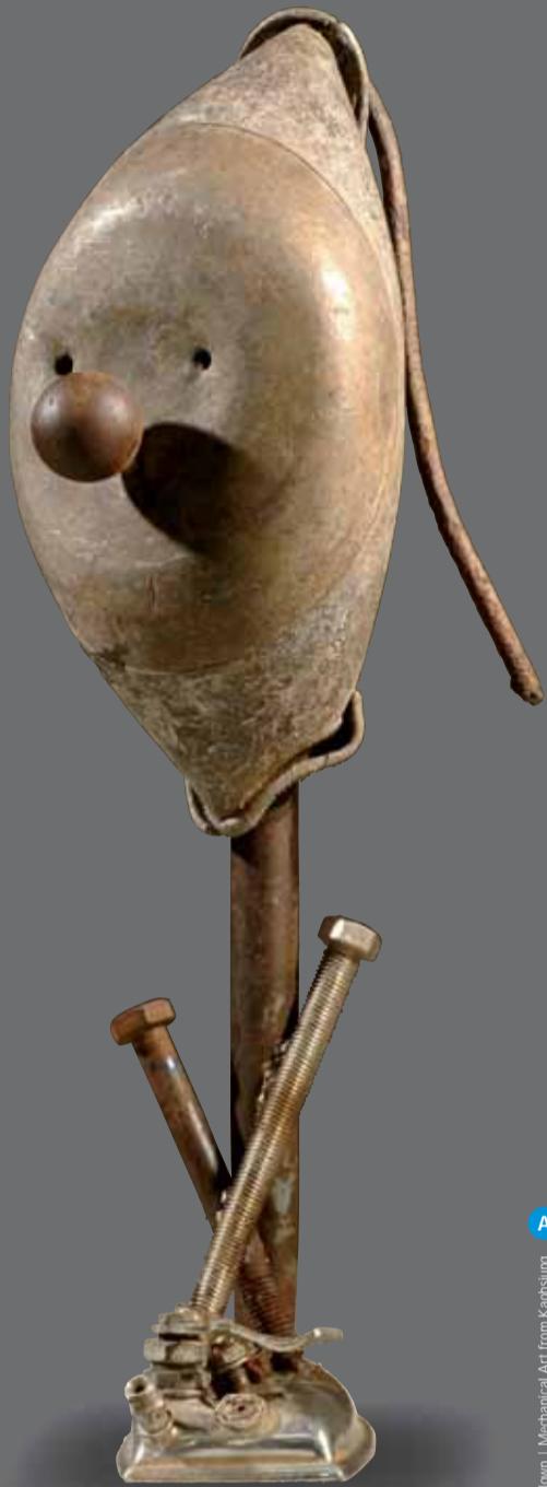
Clown | Mechanical Art from Kaohsiung

ContainerArt Shuttle by Mini: da Piazza Matteotti a Corso Italia. Per visitare i 3 container a Corso Italia e poi rilassarsi in spiaggia. Un servizio gratuito di shuttle con autista offerto da Mini. Domenica 8 giugno dalle ore 11 alle ore 15. Punto di partenza Piazza Matteotti 8 davanti al container.