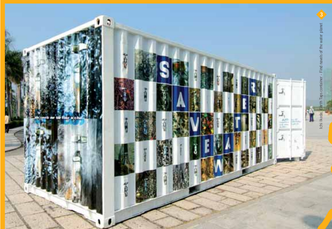
Ichii Ikeda | Earth Taps container - Find jewels of the water planet

Il libro-manifesto di ContainerArt. Disponibile nei migliori bookshop.